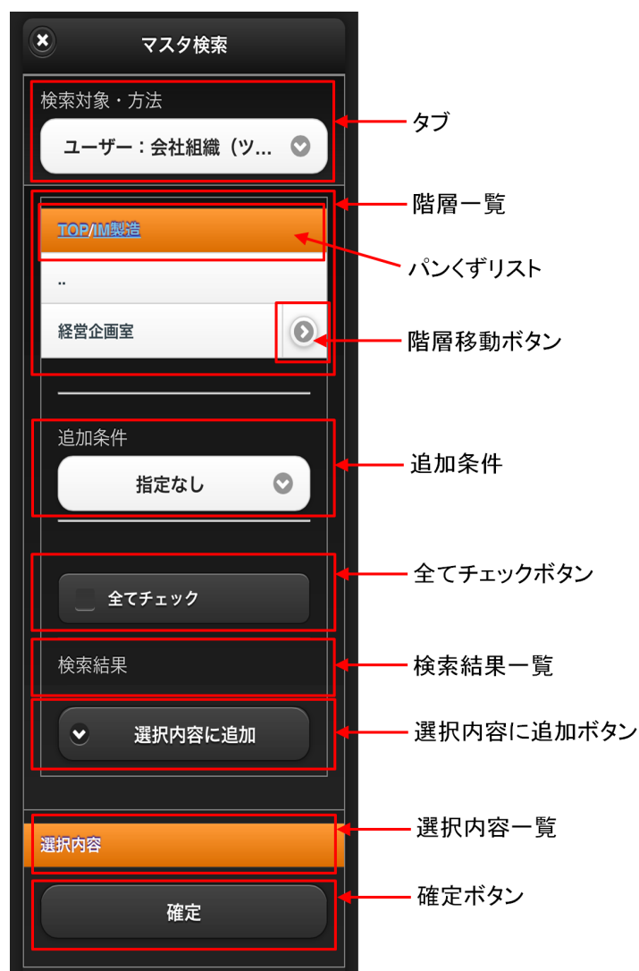
【図：階層+追加条件一覧】