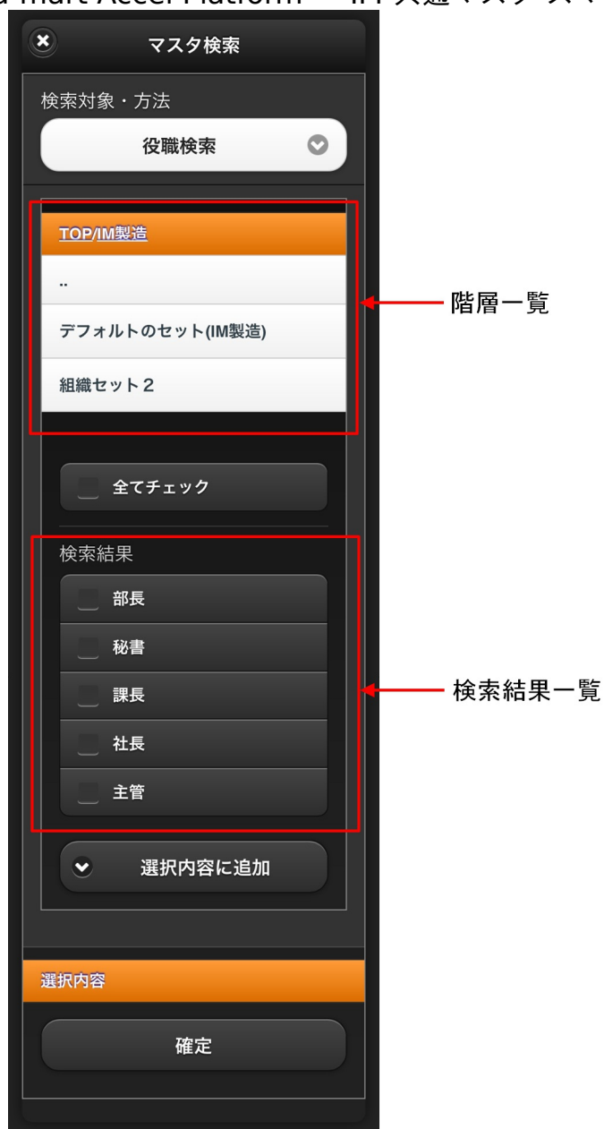
【図:役職検索タブ 画面表示】