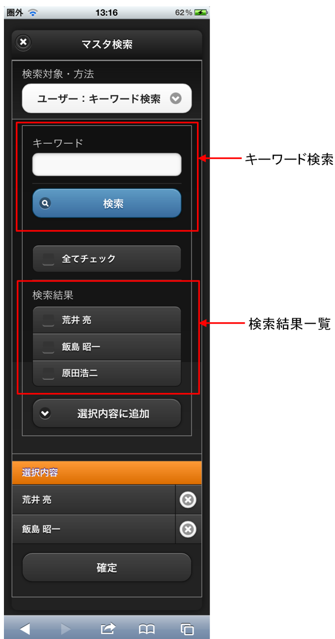
【図：ユーザ検索（キーワード）タブ 画面表示】