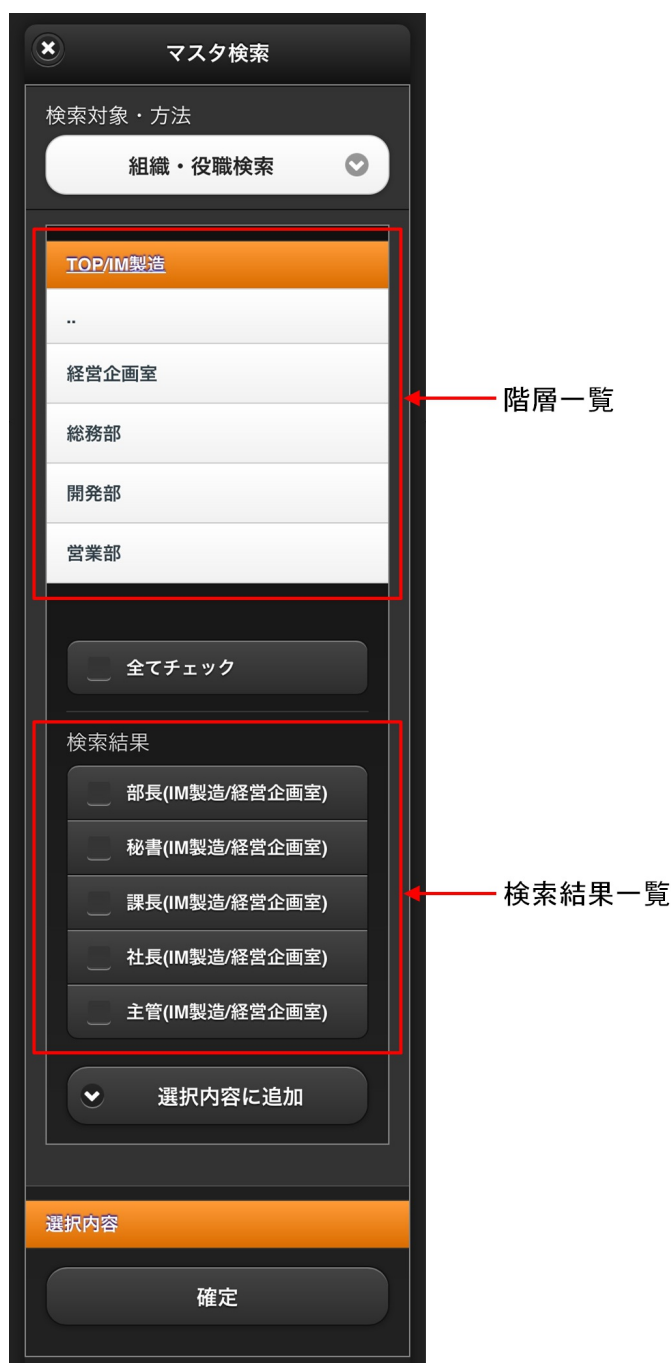
【図：組織・役職検索タブ 画面表示】