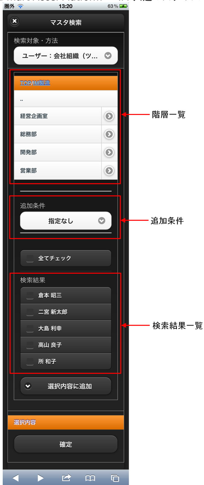
【図：ユーザ検索（組織）タブ 画面表示】